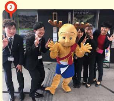
② この春もインターンを受け入れました。今回は4名！彼らからも学びと刺激を受けています。