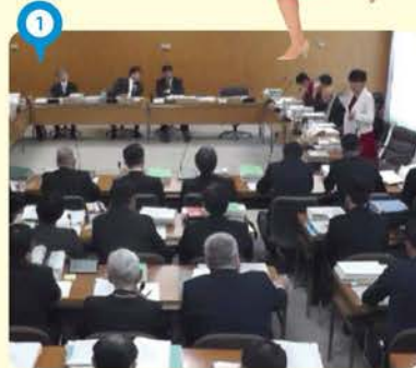
① 当選以来2回目の予算委員会に所属。一週間みっちり新年度予算について審議をしました