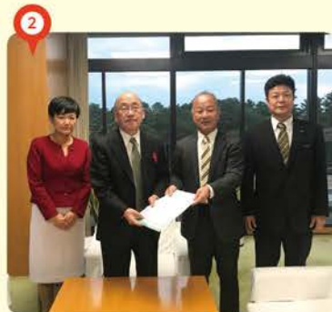
② 少なくとも基準値を超えるように知事に改めて速やかな措置を要望