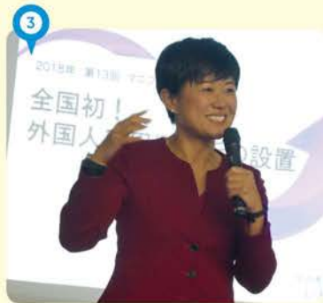
③ 外国人避難所の事例発表。四国中国からも地方議員の参加あり。広まるといいな。