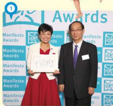
① 「全国初の外国人避難所設置」でマニフェスト大賞優秀政策提言賞を受賞。